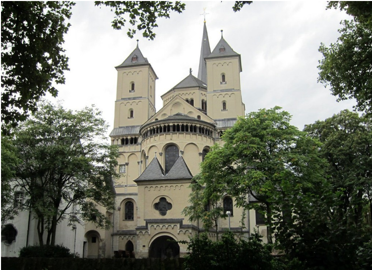
Pfarrkirche St. Nikolaus in Pulheim-Brauweiler, Ansicht aus dem Abteipark (2011).