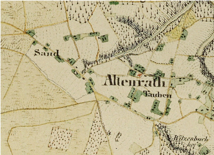
Der Bereich um das heutige (Troisdorf-) Altenrath auf der historischen Karte der preußischen Uraufnahme von 1836-1850. Links im Kartenausschnitt ist noch die untergegangene ehemalige Siedlung Sand zu sehen.