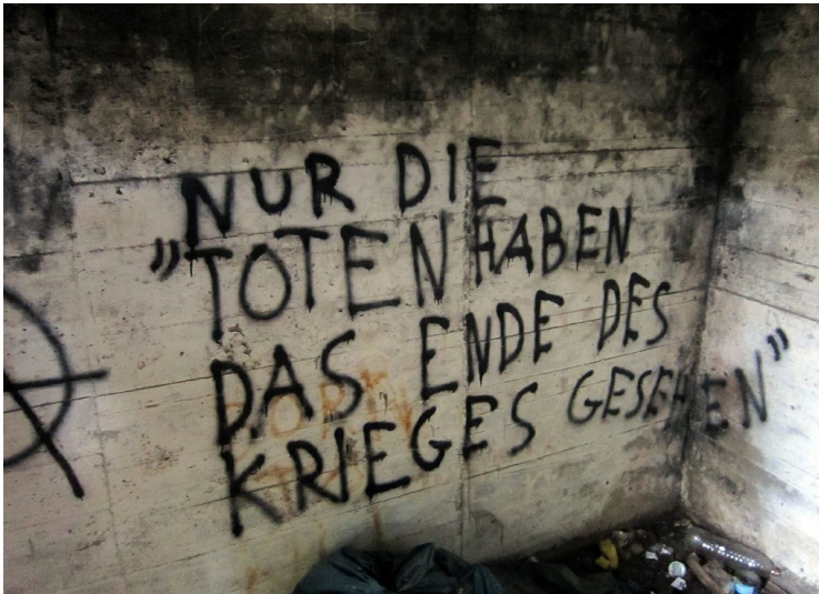
Stahlbeton-Bunker an der Artilleriestellung Sicherheitsstand 11 in der Wahner Heide (2011). Das Graffiti im Inneren lautet "Nur die Toten haben das Ende des Krieges gesehen".