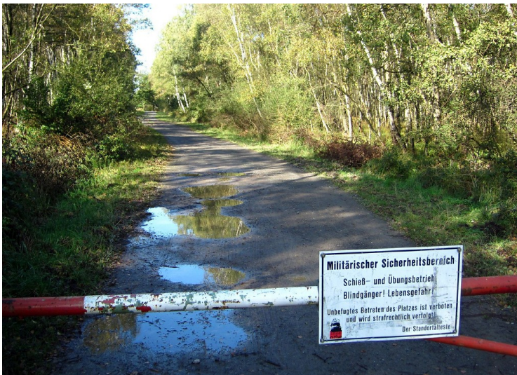
Eine Schranke auf einem Weg in der Wahner Heide versperrt den Zugang zu einem militärischen Sicherheitsbereich (2011).