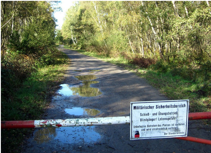
Eine Schranke auf einem Weg in der Wahner Heide versperrt den Zugang zu einem militärischen Sicherheitsbereich (2011).