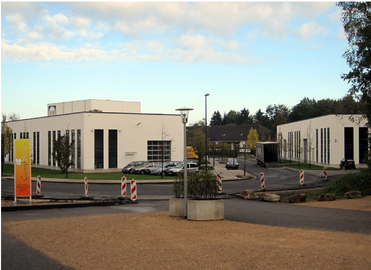
Teil der ehemaligen Kasernenanlage Camp Roi Baudouin (Kamp Koning Boudewijn), heutiges Gewerbegebiet Camp Spich (2011)