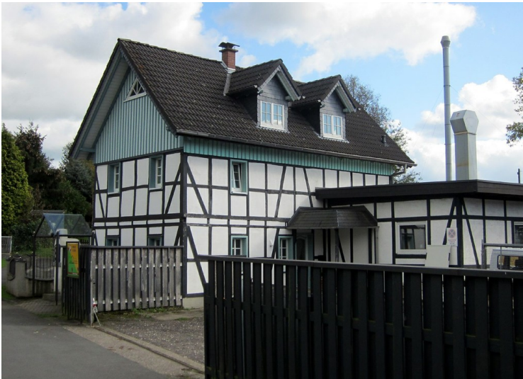
Weiler Dahl bei Altenrath (2011)