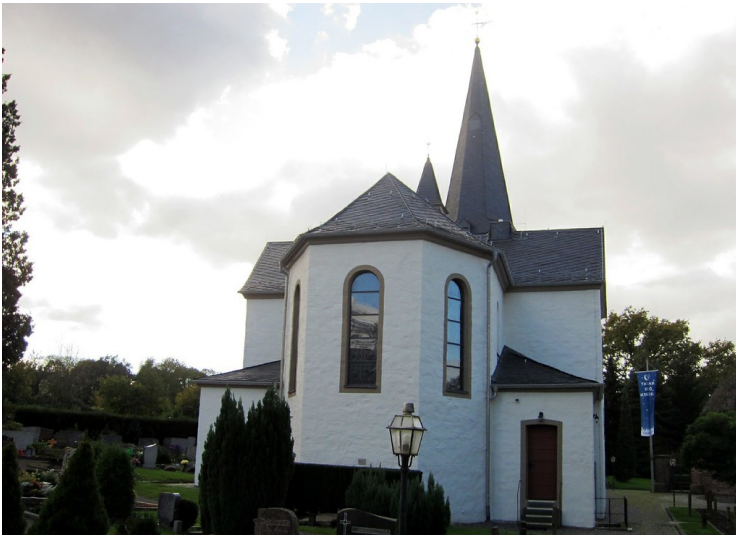
Pfarrkirche an der Flughafenstraße in Altenrath (2011)