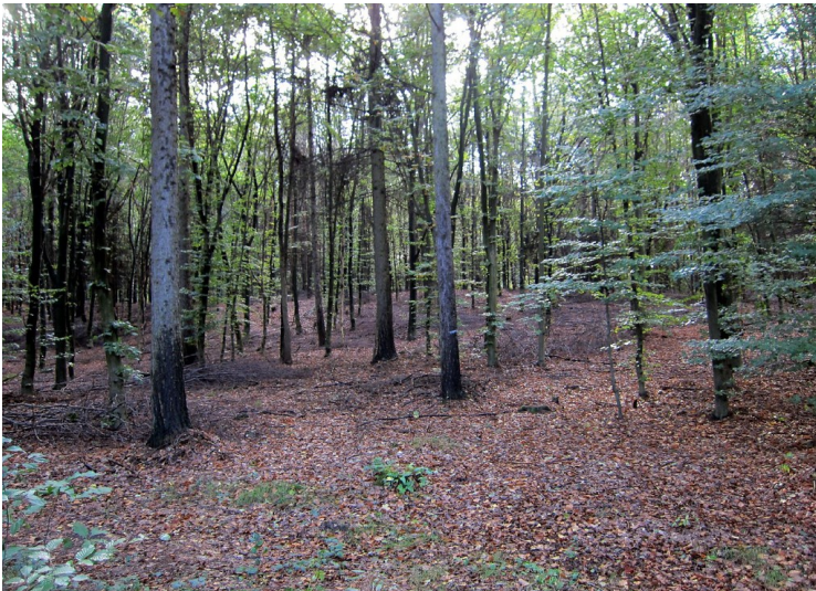
Fliegenberg an der Wahner Heide (2011)