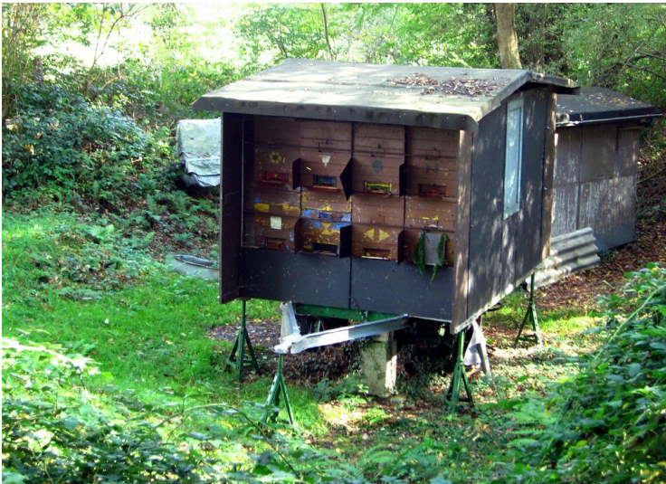
Bienenhäuser an der Grube "Versöhnung" bei Altenrath (2011)