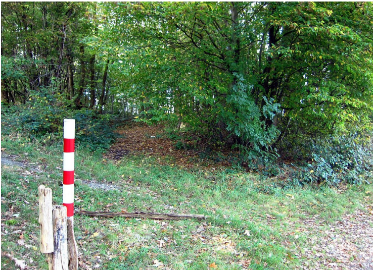
Grube Versöhnung bei Altenrath (2011)