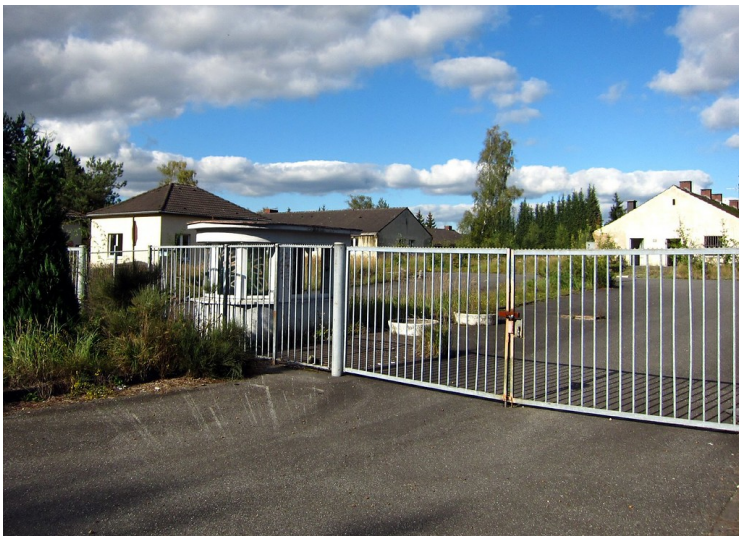
Der Eingangsbereich der ehemaligen Kasernenanlage Camp Major Legrand (2011).