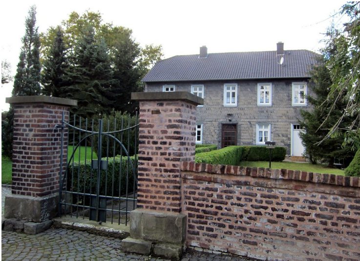
Pfarrhaus in Altenrath (2011)