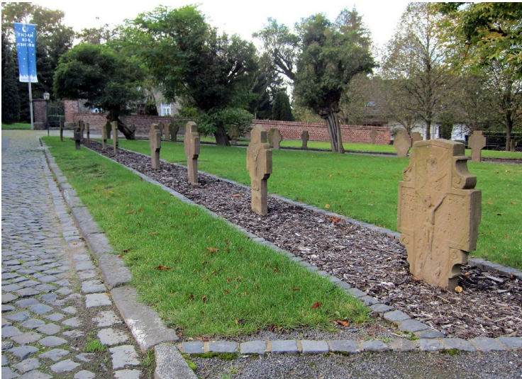
Grabsteine aus der untergegangenen Ortschaft Sand an der Pfarrkirche Sankt Georg in Altenrath (2011)