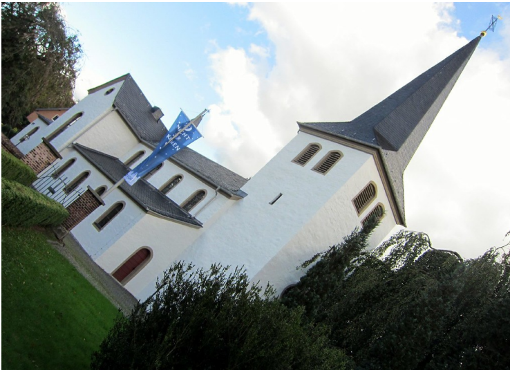
Pfarrkirche Sankt Georg in Altenrath (2011)