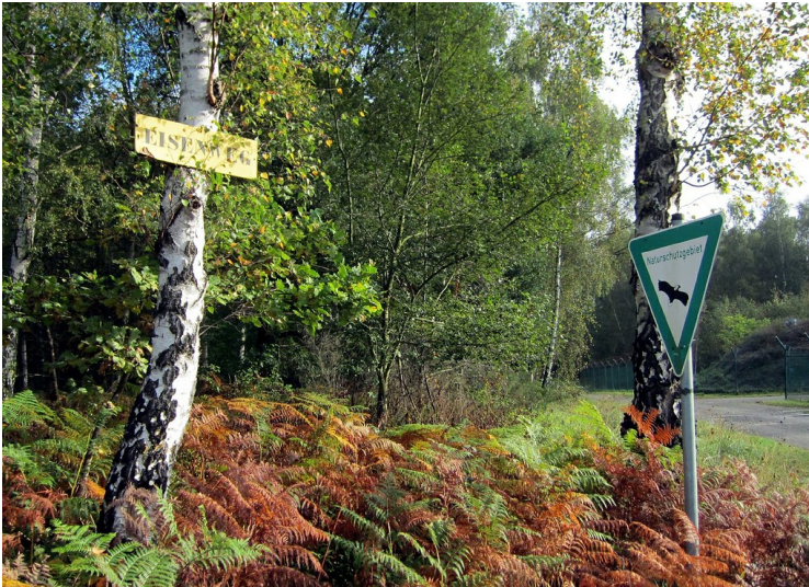
Ein Stück des Eisenwegs von Troisdorf-Spich nach Lohmar (2011).