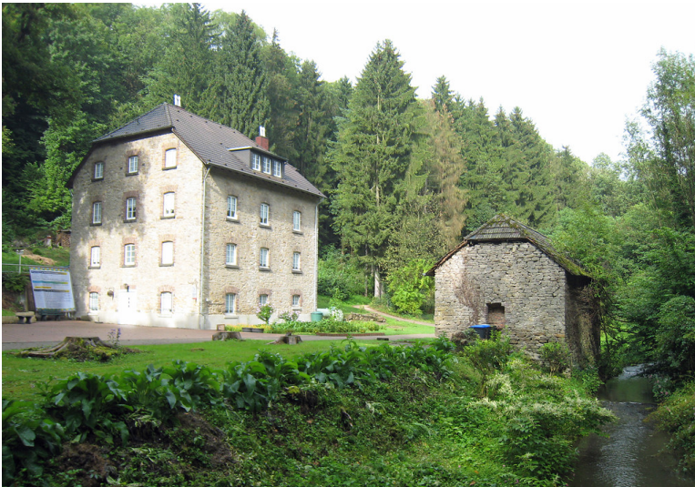
Igeler Mühle