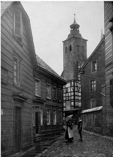
Historische Aufnahme des Ortskerns von Wichlinghausen mit der 1927 niedergebrannten Alten Wichlinghauser Kirche (undatiert, vor 1927).