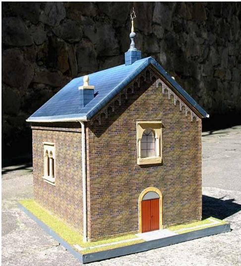
Modell der ehemaligen Synagoge Oberdollendorf im Maßstab 1:30, erstellt von Karl und Olaf Schumacher für die Sonderausstellung "Jüdisches Leben in Königswinter" 2006/2007 im Brückenhofmuseum.