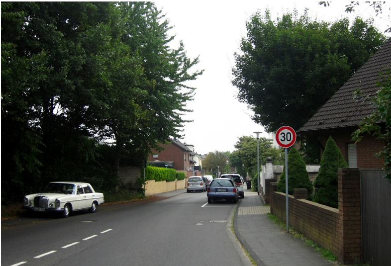
Der Marienbornweg in Hürth. Hier befand sich der später untergegangene Friedhof der jüdischen Gemeinde Hürth (2013).