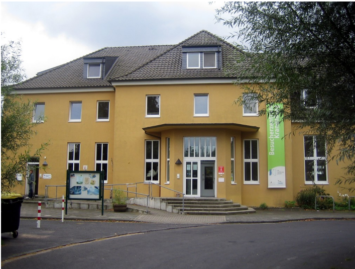
Bahnhofsgebäude Kranenburg (2011)