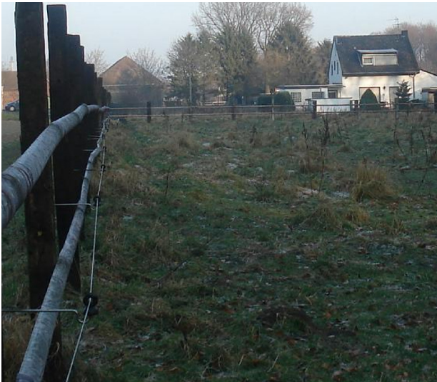
Der Huckelshof in Krefeld-Forstwald mit den zugehörigen Landwirtschaftsflächen