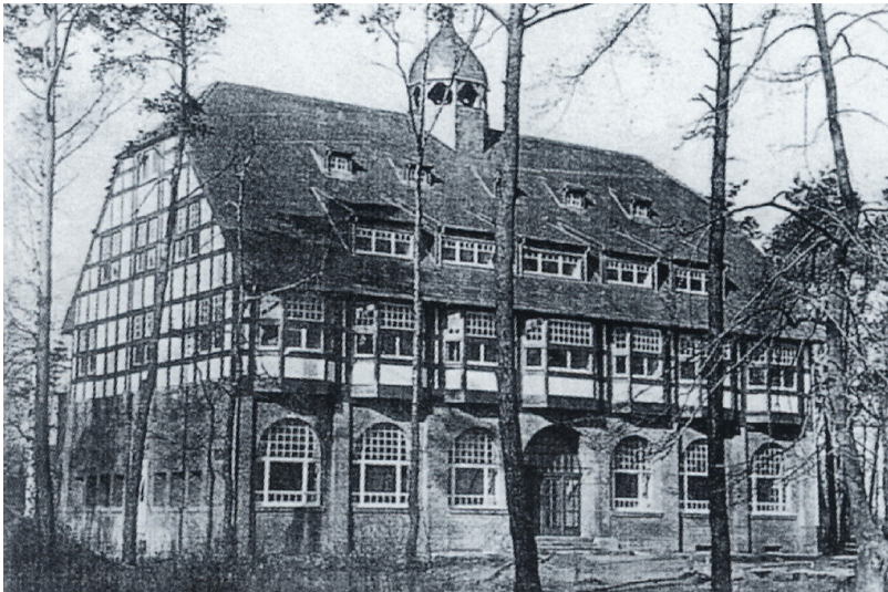
Historische Aufnahme des 1905 erbauten Hotels Praasshof