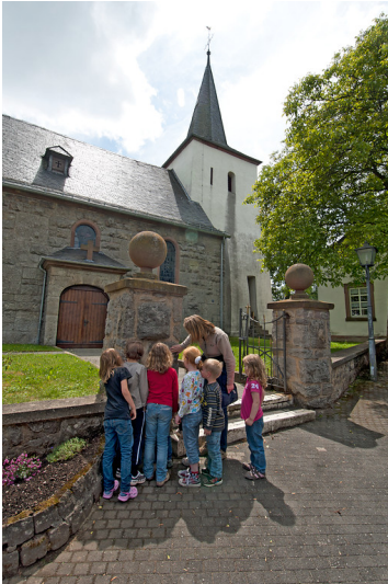
Nettersheim-Frohngau, Pfarrkirche Sankt Margareta (2011).