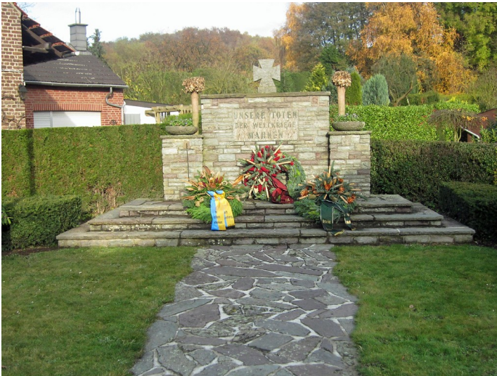
Kriegerehrenmal in Birgelen (2012)