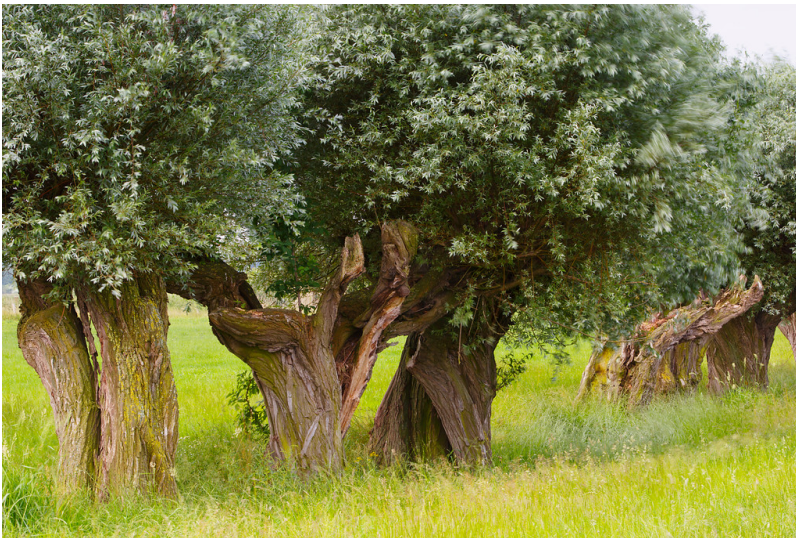
Kopfbweiden im Naturschutzgebiet Hetter bei Emmerich (2013).