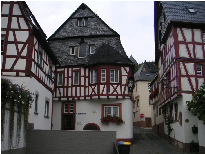
Ansicht des Fachwerkhauses Auf dem Bach 5 in Briedel (2020).