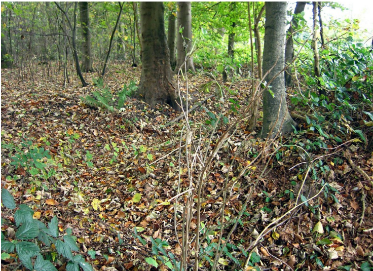
Splittergräben im Forstwald (2011)