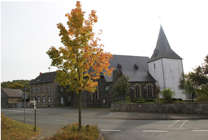
Pfarrkirche St. Luzia in Uess (2012)