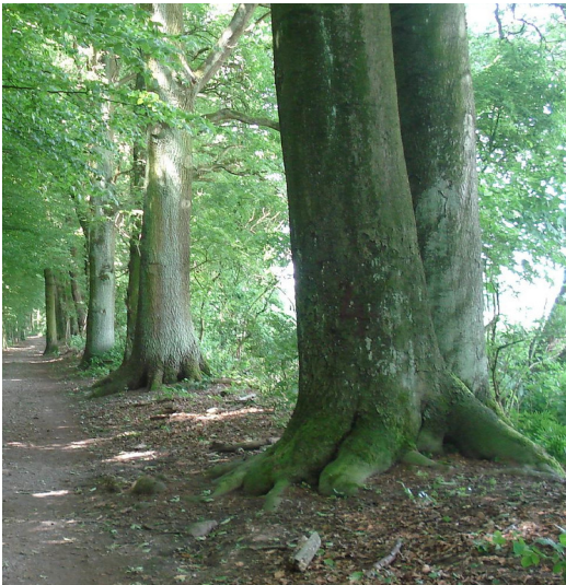
Der mit Bäumen besetzte Grenzwall des einstigen Schumacherschen Besitzes in Krefeld-Forstwald