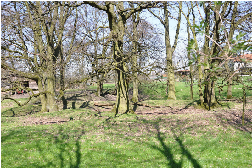
Lehmgruben an der Oberbenrader Straße in Krefeld-Forstwald