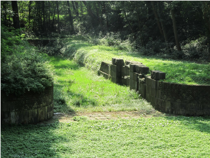
Straelen, Kr. Kleve, Schleuse Louisenburg