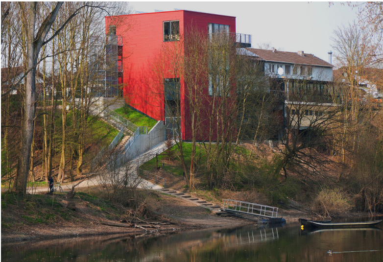
Fischereimuseum Bergheim an der Sieg in Troisdorf (2011).