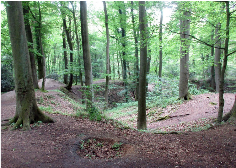
Die im Gelände heute noch gut auszumachenden Sandgruben bzw. -kaulen im Königsdorfer Wald bei Pulheim-Dansweiler (2019).