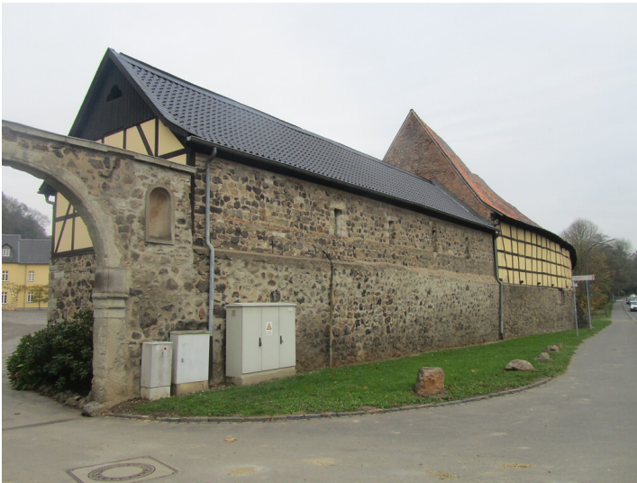
Die Wirtschaftsgebäude von Gut Marienforst sind aus Bruchsteinmauerwerk und in Fachwerkbauweise errichtet (2014)