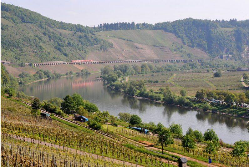
Das von Weinbaulagen umgebene längste Hangviadukt Deutschlands gegenüber der Ortschaft Pünderich an der Mosel (2010).