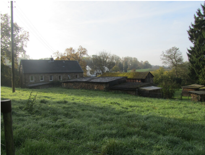
Wohn- und Wirtschaftsgebäude der Pecher Mühle (2014)