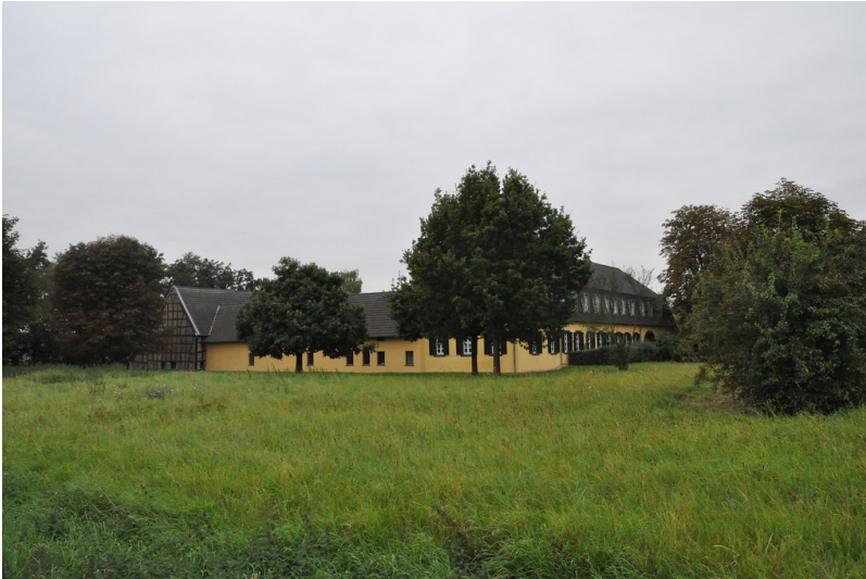
Palmersdorfer Hof (2014)