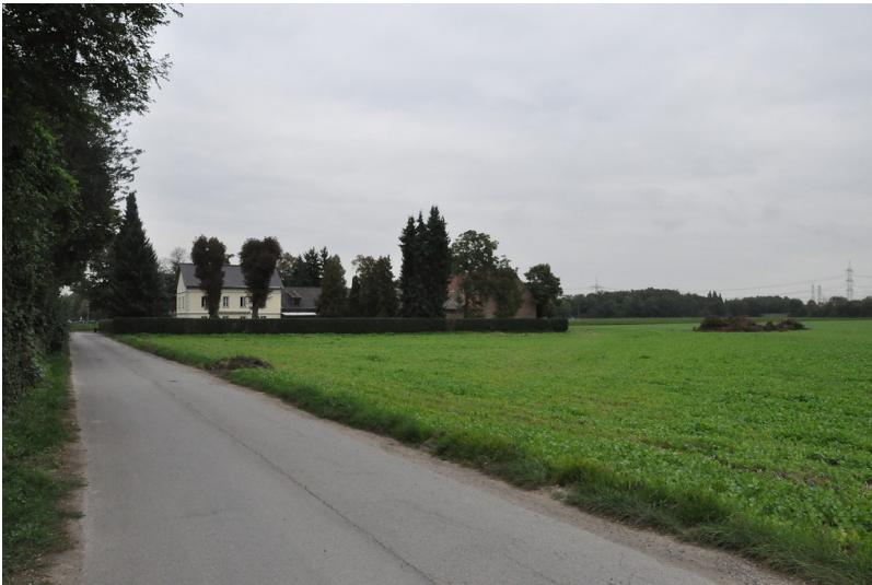
Der Falkenluster Hof mit Hausbäumen und Hofhecke inmitten landwirtschaftlicher Nutzfläche (2014)