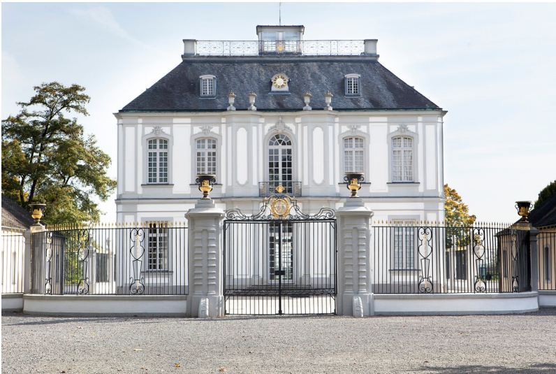
Außenansicht des Jagdschlusses Falkenlust in Brühl (2015)