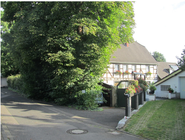
Weierhof in Brühl-Schwadorf (2014)