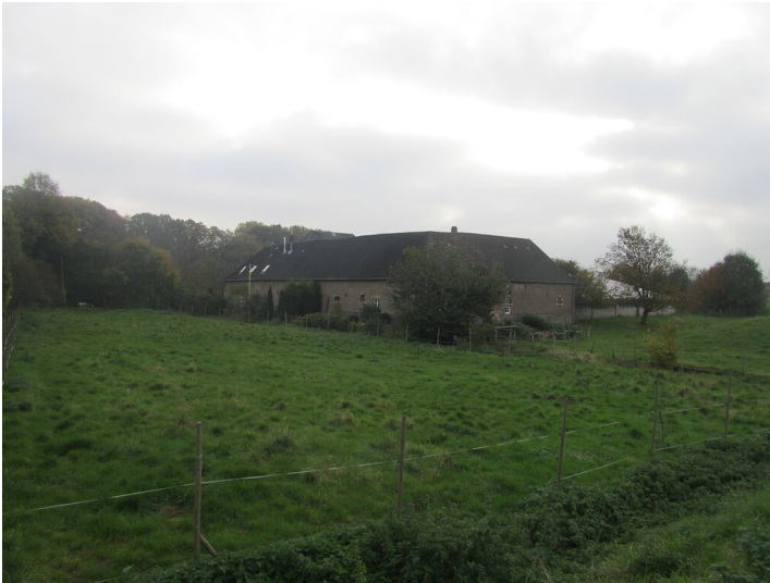
Blick von Nordosten auf die mehrflügelige Anlage des Schäferhofes in Adendorf (2014)