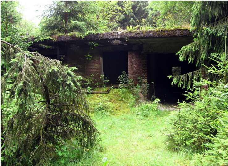
Außenansicht der Ruine der Adenauervilla (2012).