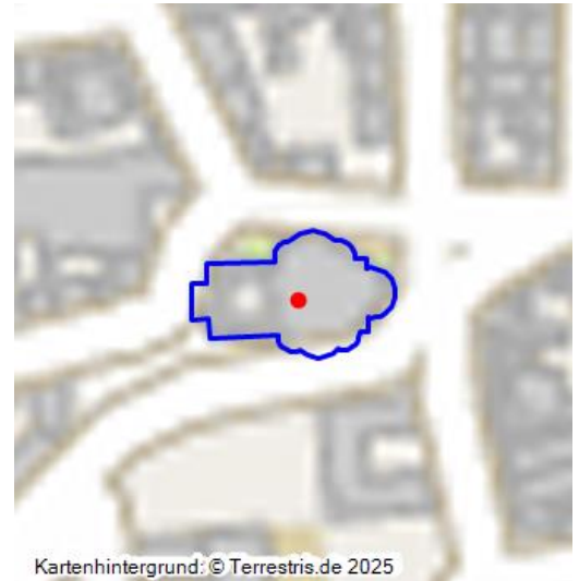
Kartenhintergrund: © Terrestris.de 2025