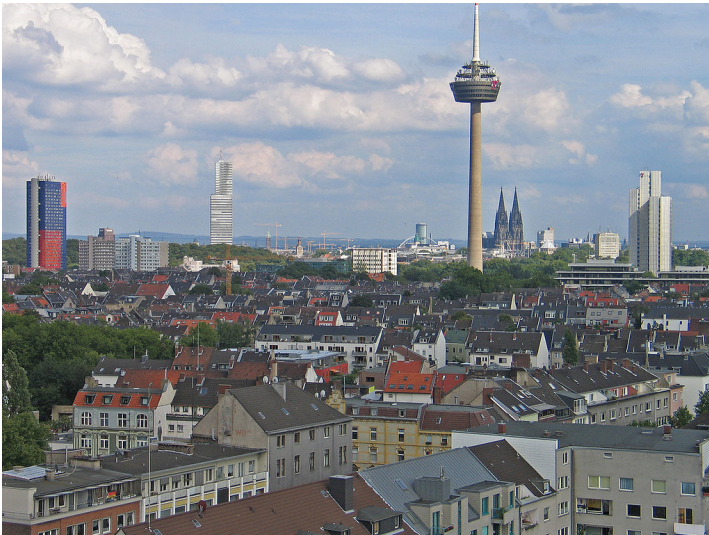
Köln-Ehrenfeld und Fernmeldeturm "Colonius" (2006).