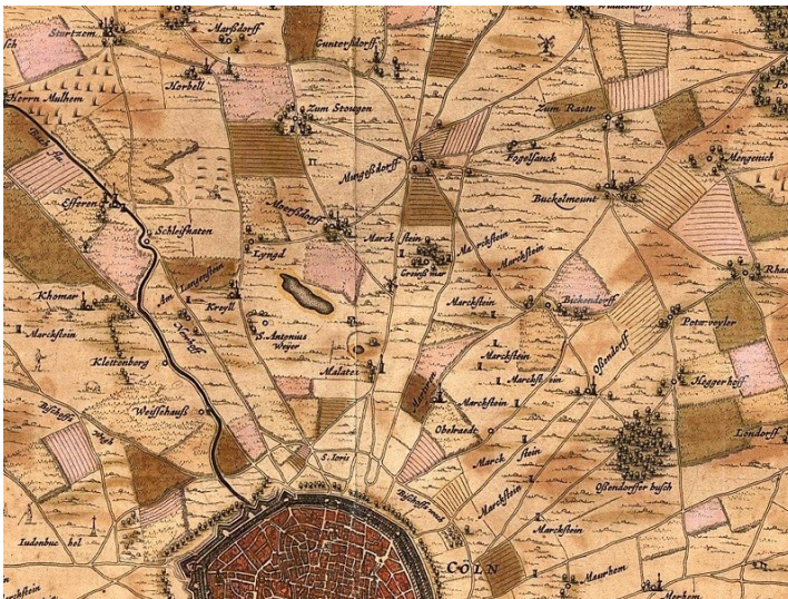
Ausschnitt eines Kupferstichs von Joan Blaeu (1596-1673), die auf 1663 datierte Karte "Descriptio Agri Civitatis Coloniensis" zeigt die Umgebung von Köln.