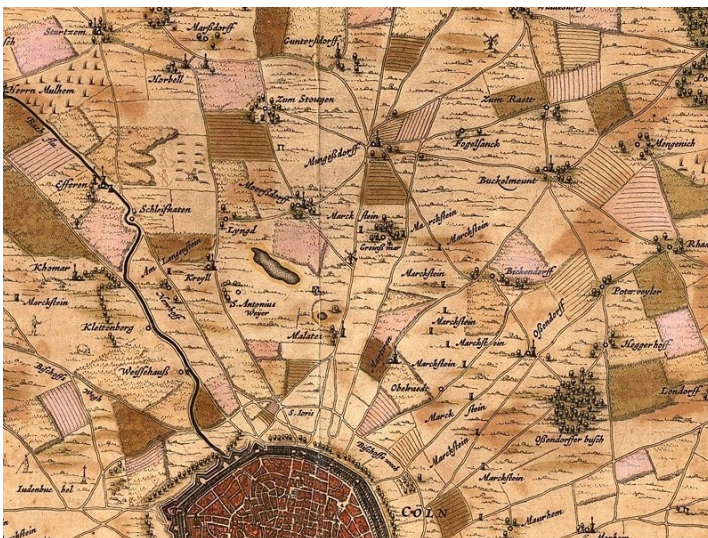
Ausschnitt eines Kupferstichs von Joan Blaeu (1596-1673), die auf 1663 datierte Karte "Descriptio Agri Civitatis Coloniensis" zeigt die Umgebung von Köln.