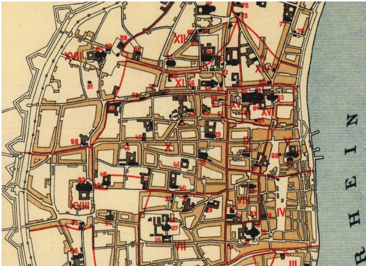
Ausschnitt aus der Karte "Kirchliche Organisation und Verteilung der Confessionen, Übersicht über die Kölner Kirchen (...)" c. 1610 im Bereich der Kölner Altstadt (1903).