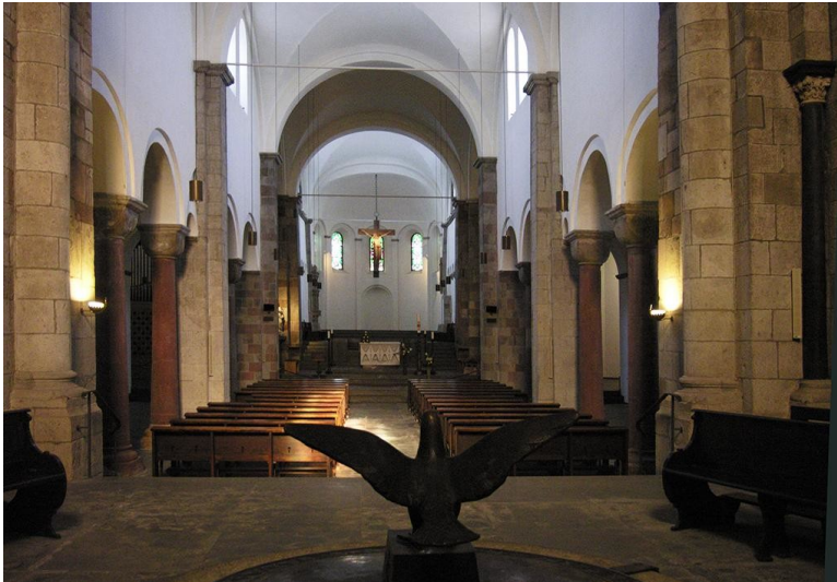
Blick durch das Langhaus der früheren Stiftskirche des Kollegiatstifts St. Georg (Georgstift) in Köln (2005)