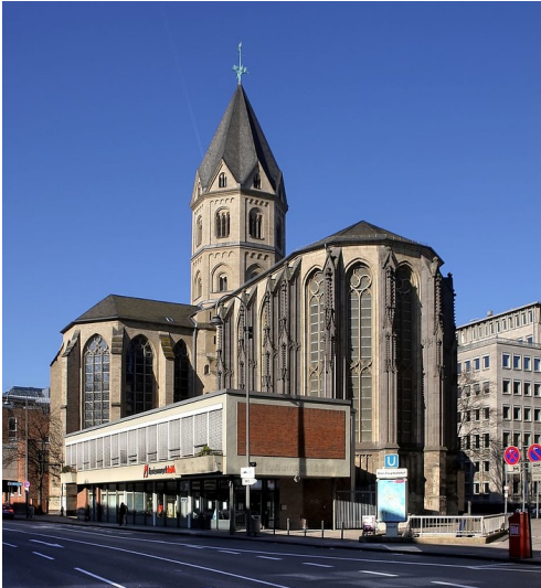
Blick auf die Kirche des früheren Kollegiatstifts Sankt Andreas in Köln, Ansicht von der Komödienstraße aus mit dem Dom im Rücken (2010)