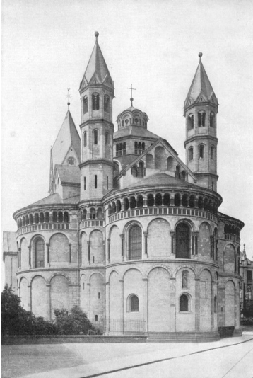
Die Kirche St. Aposteln in Köln auf einer historischen Aufnahme aus dem Buch "1000 Years of Rhenish Art" von 1925